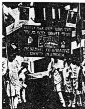
Manifestazione a Gibuti

Gibuti, Aden e il petrolio. Guardiamo la carta. E, oltre alla evidenza della pressione quasi fisica che Etiopia e Somalia operano sul territorio gibutino, ci balza agli occhi anche un'altra dimensione del problema. Di fronte a Gibuti, divisa da pochi chilometri di mare, s'affaccia Aden. E Aden, in preda a profonde ondate di risveglio nazionalistico, sta per raggiungere una turbolenta indipendenza. Insieme al possedimento inglese acquireranno una personalità indipendente anche gli sceiccati del petrolio che dalla estrema punta della penisola arabica si allungano verso Oriente, lungo le rive dell'Oceano indiano. Aden inglese fungeva anche da sentinella occidentale del petrolio degli sceicchi. Aden indipendente, in cui lotteranno, forse apertamente, le forze antagoniste di Nasser e di Saud, può avere bisogno di una terza presenza: quella rappresentata