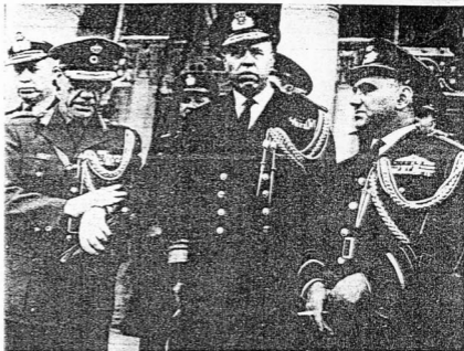
I tre capi di Stato Maggiore dell'esercito greco: ANGELIS, PERVENAS, COSTAKOS

La crisi rientrata. Trascorrono due mesi. Nel luglio il termometro della crisi segna ancora punte alte. Le conseguenze immediate del putsch escono