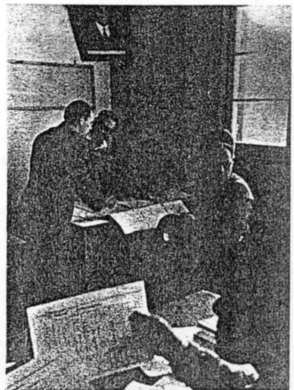
ASSUAN: il progetto della diga