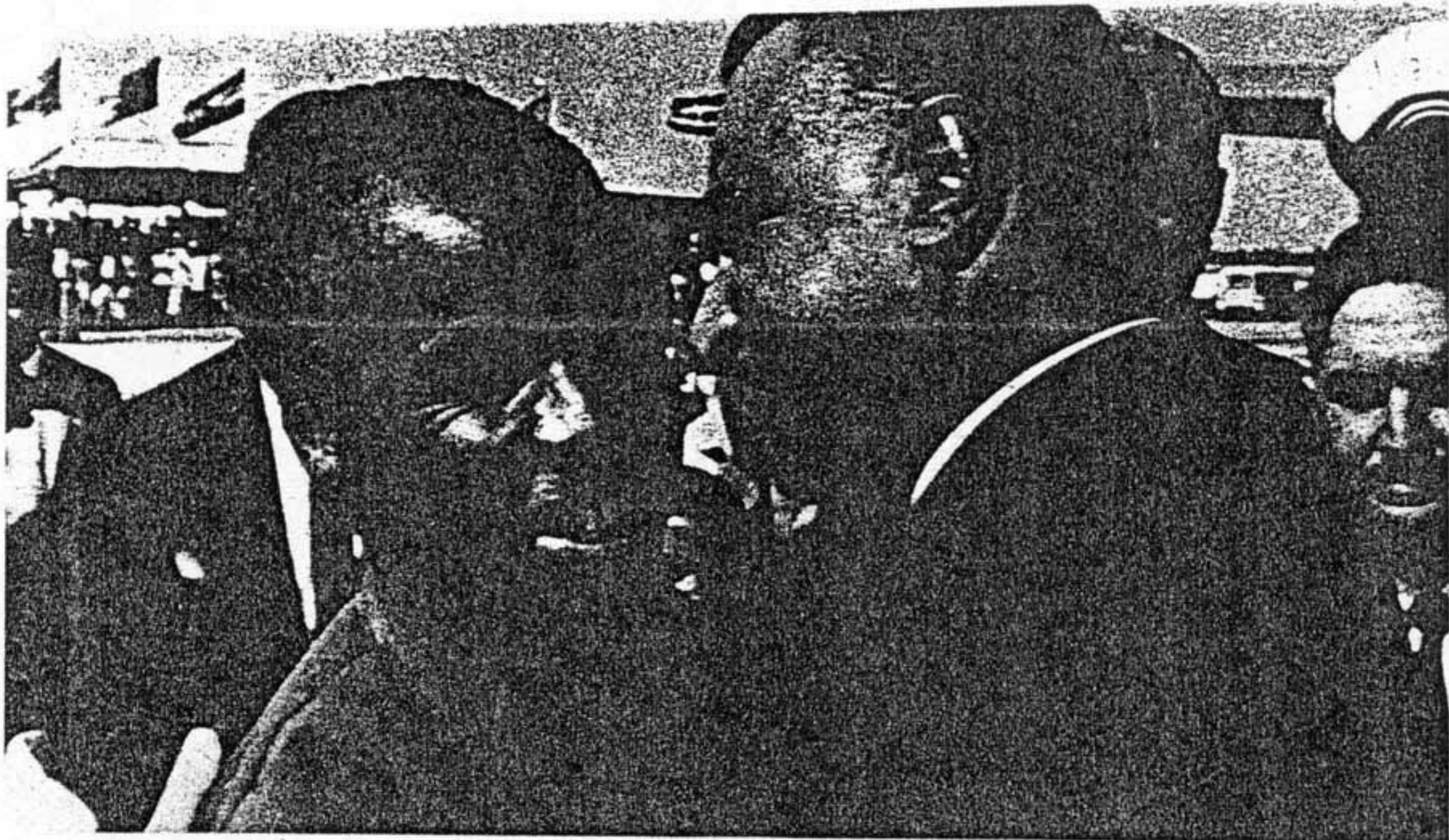
Nasser e Nyerere