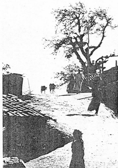
ALGERIA: la Kabilia

Il colloquio è venato di clandestinità. Chi ci parla è un alto funzionario ministeriale, un uomo che è a contatto di gomito, quotidianamente, con Ahmed Taleb il giovane ministro dell'Educazione. Rappresenta con sufficiente autorevolezza il punto di contatto fra l'opposizione confessionale degli Ulemas e quella dei tecnocrati socialisti profonda-