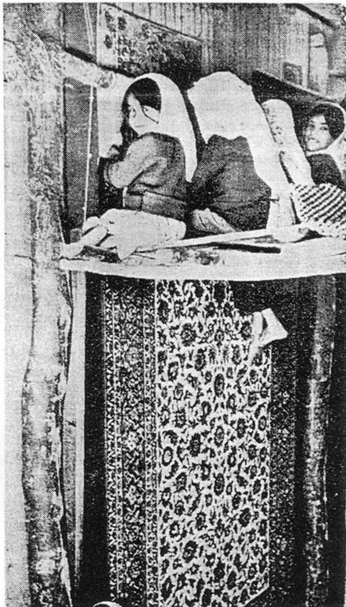
Bambini persiani al lavoro. Solo le loro esili manine possono intrecciare le complicate trame dei famosi tappeti; ma il fisico risentirà gravemente della paziente fatica

Un altro episodio che se pur non rientra specificamente nell'argomento dello sfruttamento di manodopera giovanile però serve a far capire come in questa cristianissima nazione che è l'Italia vengano trattati i bambini: è una notizia di pochi giorni or sono. Le suore di una scuola elementare hanno sevizato un bambino accusato ingiustamente di aver sottratto 50 lire ad un