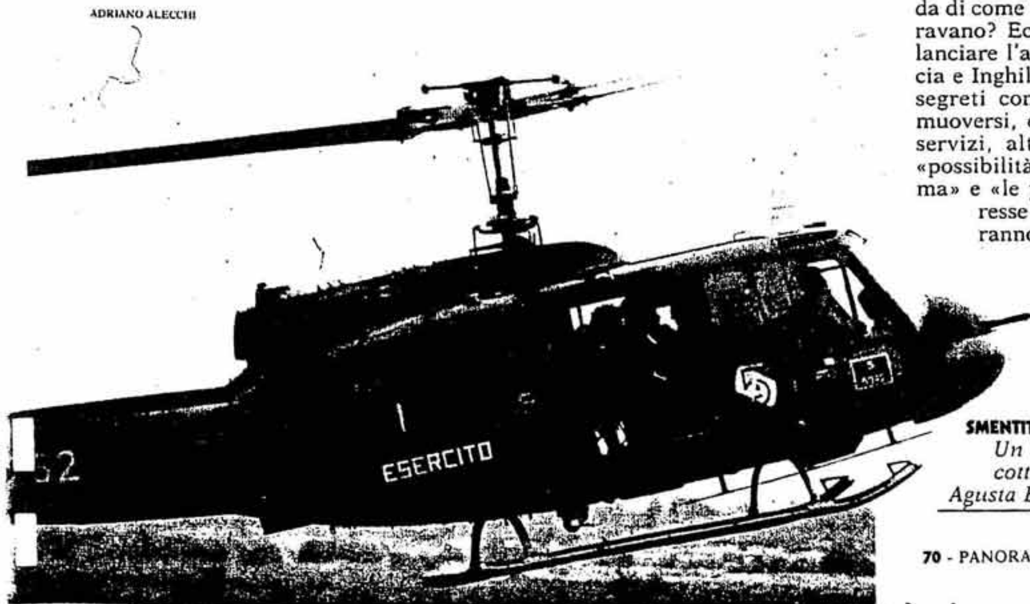
SMENTITA. Un elicottero Agusta Bell

Aldo Moro, in quel periodo ministro degli Esteri, lesse con attenzione quei messaggi, se oggi, tra i documenti dell'inchiesta Mastelloni, c'è questo appunto autografo pieno di