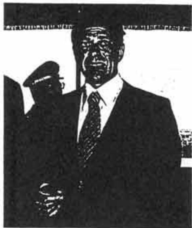
FIRMA. Matteo Matteotti, ex-ministro del Commercio estero

politica parallela, fatta di preoccupazioni legittime di tenere fuori l'Italia dal circuito terroristico e di non farla uscire invece dai giri economico-finanziari legati agli arabi. Solo che tutti questi sforzi non sembrano essere stati ripagati dagli uomini vicini ad Arafat con analoghi atteggiamenti di aiuto. È vero che Arafat in persona intervenne nei giorni più drammatici del sequestro di Aldo Moro contro le Brigate rosse sconfessando il loro ope-